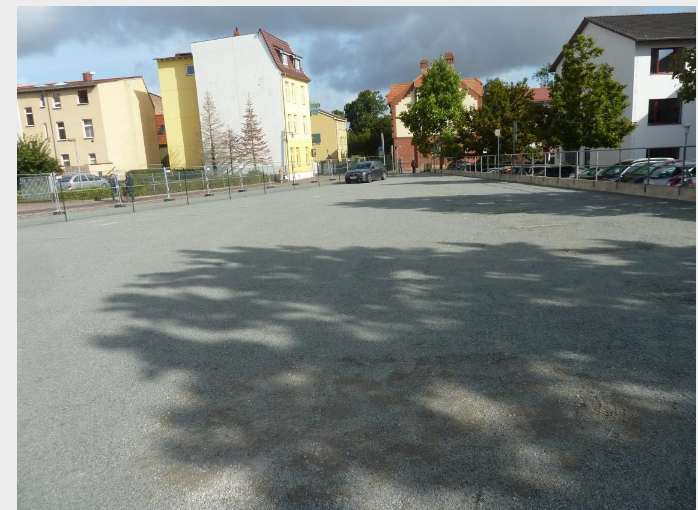
Herrichtung eines Interimparkplatzes nach Abbruch der ehemaligen Werkstattgebäude von PGH-Motor (Tiefetal 12) und Küchenstudio Westphal (Pferdemarkt 39)